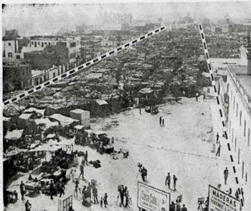
ULTIMOS DIAS DEL "TACORA MOTORS" — Las líneas punteadas indican la amplitud del tramo de la Av. de la Aviación que será reconstruido en la zona que ahora ocupan las tiendas improvisadas del "Tacora Motors", sindicado como nido de reducidos de autos robados.