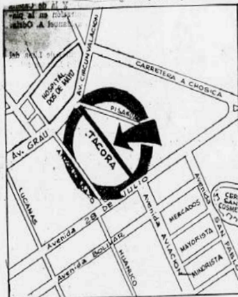
UN TAPÓN MENOS. —Eliminado el dudoso mercado de "Tacora Motors", el denso tránsito de la Av. de la Aviación y Mercado Mayorista podrá correr sin obstáculos hacia las Avda. Grau y Circunvalación. Las obras empezarán en breve.

Expuso que ésta estaría concluida a fines de año. La aprobación de los planos respectivos de la obra por los miembros del Servicio Técnico Metropolitano, se produjo anteayer al mediodía.